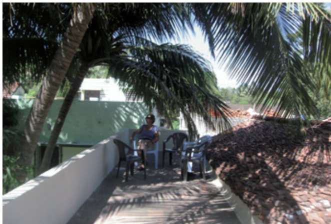
Fra den ny tagterrasse (K. Helles)

PS. I skulle prøve at bo i huset i juli måned, det er som den danske sommer, som den var engang!