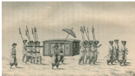
Guvernøren i sin palanquin ledsaget af indiske tjenere og soldater, de såkaldte Pioner (illustration fra Møhl: "Indiske Breve", 1840)

lovpriste Hinduers Skjønhed; dog havde han en lille smuk nøgen Søn med sig. Vi krydsede os frem til ud paa Aftenen, og ankrede ved Fyret fra Dansborg paa Trankebars Rhed omtrent Kl. 9 om Aftenen.