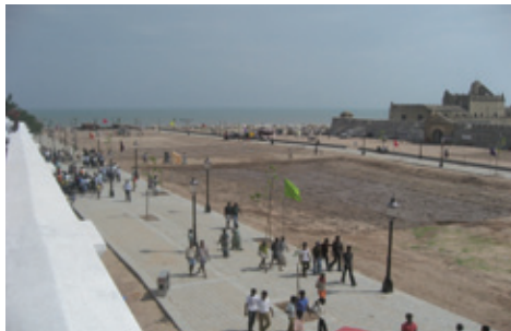
Paradepladsen set mod sydøst november 2011 (K. Helles)