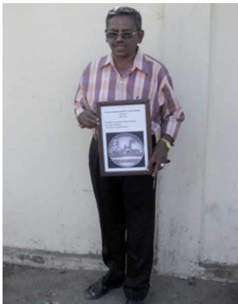
Sultan med hædersdiplomet (K. Helles)

som skete, da vi renoverede Fort Dansborg og troede, at vi fremover kunne få indflydelse på driften af museet. Inderne sagde tak og tog over på bedste indiske vis, da en museumslovgivning fra 50erne lagde hindringer i vejen for nogen som helst nytænkning og samarbejde med udlændinge. Desværre, men vi må jo bøje os for virkeligheden, og det er trods alt ikke