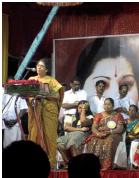
Tamil Nadus minister for turisme på tribunen ved den indiske indvielse af guvernørboligen. I baggrunden et stort billede af chief minister Jalayalitha (K. Helles)

En del af de mange besøgende lagde vejen forbi vores lille Maritime museum i Dronnin-