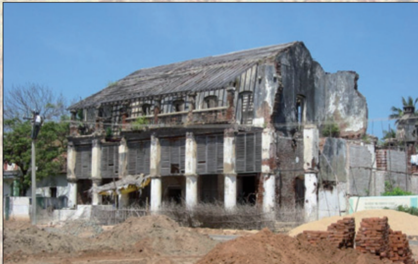
Guvernørboligen i februar 2010 (K. Helles)