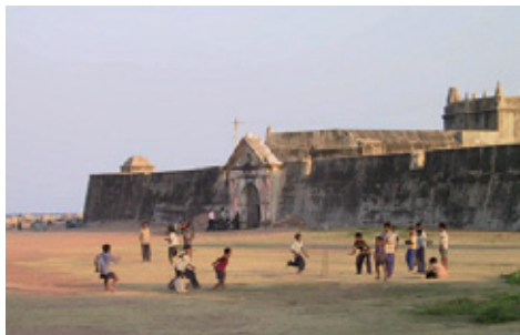
Paradepladsen set mod sydøst o. 2008