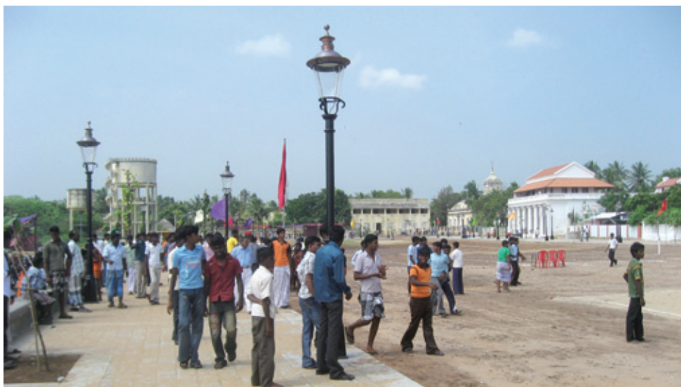
Paradepladsen set mod vest november 2011 (K. Helles)