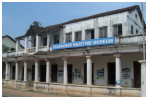
Van Theilingens hus februar 2011 kort før TMM flyttede til Dronningensgade (K. Helles)

De fleste af de projekter, der blev startet efter Tsunamien i 2004, er blevet færdiggjorte.