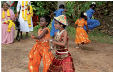
Optræden ved indvielsen af den tropiske have (P. Petersen)

vores ambassade i New Delhi. På bedste folkelig vis indviede Svane både Guvernørboligen, den tropiske have og granitstenen.