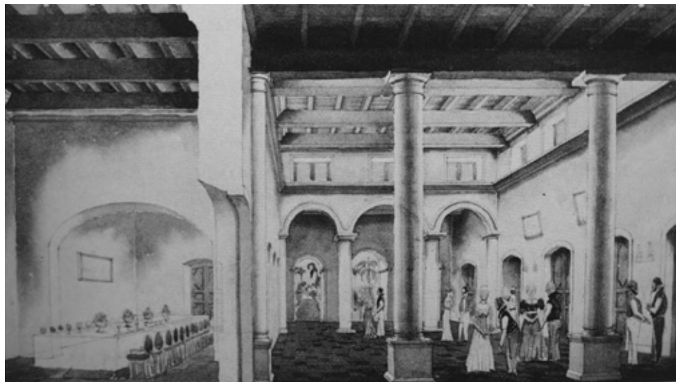
Selskab i guvernementshuset i 1830'erne. Der dances i den overdækkede gård efter middagen i spisestuen til venstre. (tegning af Jens Damborg, i Architectura 9. Arkitekturhistorisk Årsskrift 1987)

anse sig lige berettigede til en gunstig Modtagelse. Enhver bringer gjerne en Anbefalingskrivelse med sig. Nogle have hele Haanden fuld af slige Dokumenter. De gjøre idelig Salam, som er en Hilsen, der bestaaer i en bøiet Stilling med den ene eller begge Hænder for Panden. De udvortes Høflighedsbeviser ere mange og fremmede, og man veed ikke ret, hvad de betyde. Flere havde en Limon i Haanden, som de række frem og ville introducere sig med. De forstaae ogsaa godt at tale for sig og insinuere sig; men de tale det danske Sprog meget forkeert, og bruge de latterligste Udtryk, som "Mandfølkekat" for "Hankat", Hønsemænd" for "Hane", Koes Barn" for "Kalv", Pigehest" for "Hoppe". En gav til Svar paa det Spørgsmaal, om han var gift, at hans Kone var en Bjørn, i stedet for et Barn; thi Tamulerne slutte Ægteskabscontracter mellem Personer af meget ulige Alder, saaledes at Konen og undertiden Manden med ere Børn flere Aar før Ægteskabet fuldbyrdes. Manden var i dette Tilfælde 20 Aar gammel og heed Virapa Masulimánien eller Musilládamánien og foregav at være af en meget høj