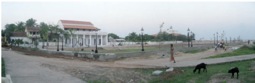
Udsigt over Paradepladsen mod nordøst med københavnerlamper og træer (K. Helles)