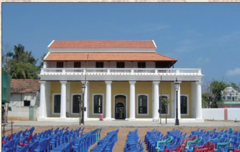
Guvernørboligen ved indvielsen i februar 2012 (K. Helles)