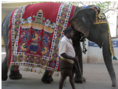
Den festligt udsmykkede elefant med sin på Kongensgade (K. Helles)

en lille cafe på førstesalen. Byens bibliotek skulle flyttes ind i huset og alt skulle ske i et samarbejde mellem repræsentanter fra Nationalmuseet i København, Bestsellerfonden og Turistministeriet, der ejer bygningen.