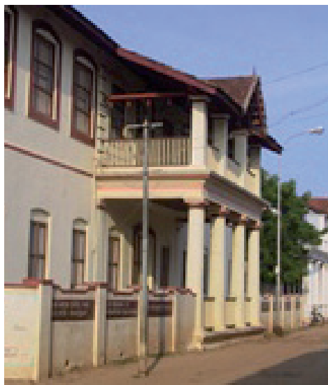
Rehlings hus i Kongensgade i dag

Leiligheder forsynet med Soelseil, meget dyb og rummeligt og spids til begge Ender. Den er sammensyet med Kokusgarn gjennem svære Planker af det stærke Tæktræ, som ere formede krumme ved Hjælp af Ild og Presning. 6-8 Personer bruges til at roe en saadan med Aarer, i Takt efter en vis Sang. Aarerne ligne ganske en Ovnrage eller flad Skovl med kort Skaft, en lignende bruges af Baadføreren til at styre med agter ude. Vi Andre fulgte efter i en anden Selling, da Saluten var givet fra Castellet. Vi kom lykkeligt igjennem Brændingen, under den sædvanlige Støi af Rorerkarlene, der her roe med den største Anstrængelse, som om de vare i Livsfare, og efter en langt hurtigere Takt, end den, de bruge udenfor paa Søen i det aabne Farvand. Saasnart Baaden støder an paa Grunden, springer Mandskabet ud, og hale den saa langt ind paa Land, som de kunne faae den, ved Hjælp af Brændingen, der vedbliver at