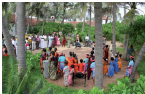
Fra indvielsen af den tropiske have