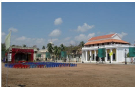
Fra Paradepladsen med tribunen foran den nyrestaurede guvernørbolig (K. Helles)

gensgade, og vores besøgstal er nu 2 år efter åbningen oppe på 25.000 - mest indere, men også flere og flere udenlandske gæster.