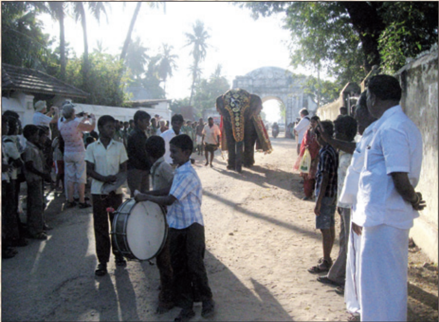
Fra starten af elefantparaden ad Kongensgade til Paradepladsen ved fejringen af foreningens 10-års fødselsdag i februar. (K. Helles)