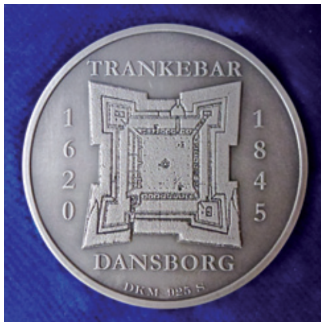
Medaljens revers (bagside): Grundrids af Fort Dansborg med årstal for erhvervelse og salg af Trankebar langs siderne.

Men bestyrelsen har samtidigt ladet et mindre