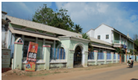
Det lille missionshus i dag, hvor Møhls bolig blev indrettet

Der var temmelig varmt iland; men Heden var endnu ikke saa stærk, som den bliver om en Måneds Tid. Dog transpirerer man bestandig og stærkt ved den mindste Bevægelse eller Anstrængelse; Sandet brænder under Fødderne gennem de tynde Skosaaler, naar man spadserer paa Gaden, og Jorden synes at lide af Tørke. Græsset er kun meget tyndt og kort, og hvor der ikke er Skygge, er det næsten henvisnet. Træerne, især Palmerne, staae dog meget frodige, og man maa undres over, at Safterne kunne komme saa høit tilveirs, og i en saa nærende Fylde fra den tørre, sandige Jord. De fleste Europæeres Huse have