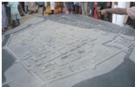
Granitstenen med plan af Trankebar (K. Helles)

Det allervigtigste var trods alt, at byens befolkning var aktive deltagere.