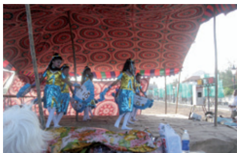
Optræden på jubilæumstribunen (K. Helles)

Nu ser det imidlertid ud til, at Turistministeriet, der ejer Guvernørboligen vil bestemme, hvad huset skal bruges til og det er de jo i deres fulde ret til, da ejendommen tilhører Government of Tamil Nadu. Det med en fælles dansk/indisk styring af huset og de fremtidige aktiviteter, var nok lidt af en drøm fra dansk side. Der sker højst sandsynligt det samme