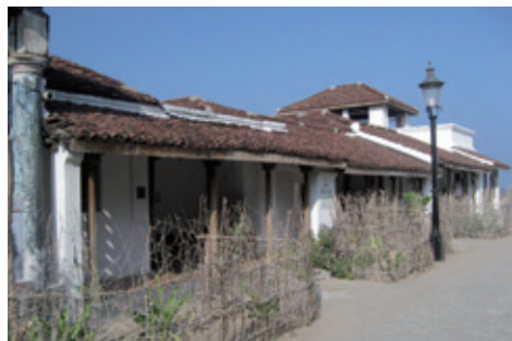
Bestsellers huse i Guldsmedegade februar 2012 (K. Helles)

25.000 kroner til oprettelse af et håndbibliotek i vores nye kulturcenter i Trankebar.